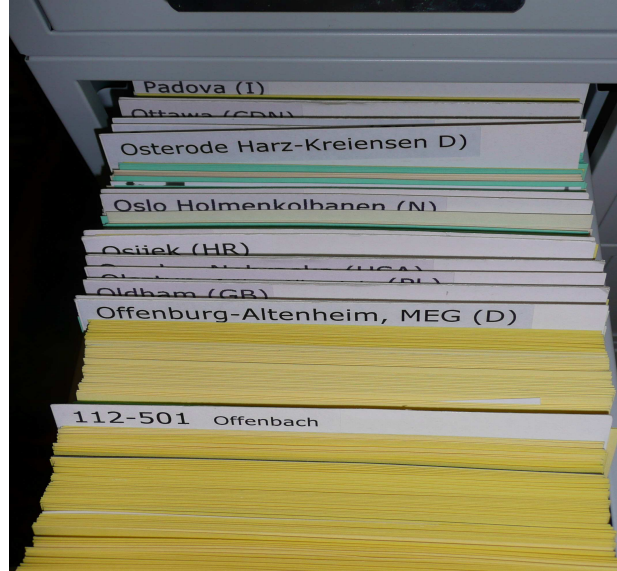
Tausende Fotos – übersichtlich geordnet !