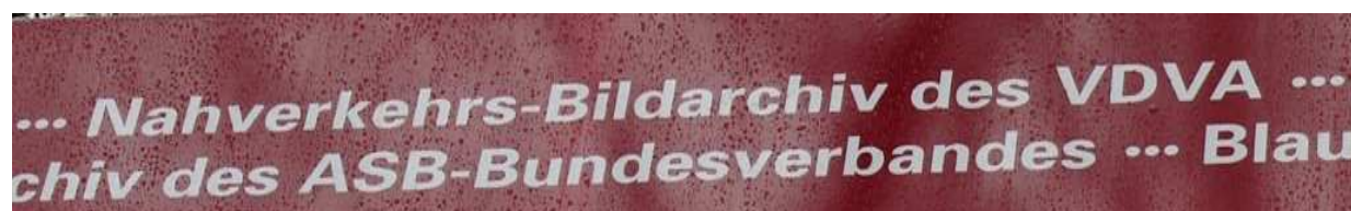
Die VDVA Bildsammlung ist Bestandteil der vielfältigen Kölner Archivlandschaft: Aufschrift auf der im Februar 2010 vorgestellten „Archivbahn“ der Kölner Verkehrs-Betriebe