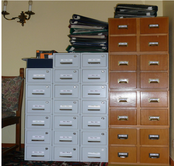
Nur ein Teil der zahlreichen Bildschätze !

Damit eine Stiftung arbeiten kann, ist ein Grundkapital in Höhe von mindestens 50.000 Euro notwendig. Die Gründung der Stiftung kann sofort umgesetzt werden, wenn feste Zusagen in dieser Höhe vorliegen.